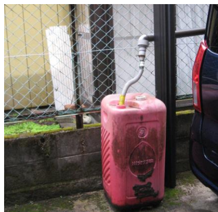
車庫の屋根の雨水をタンクに受けて、庭に散水 雨の降らない時は風呂の残り湯を入れておく