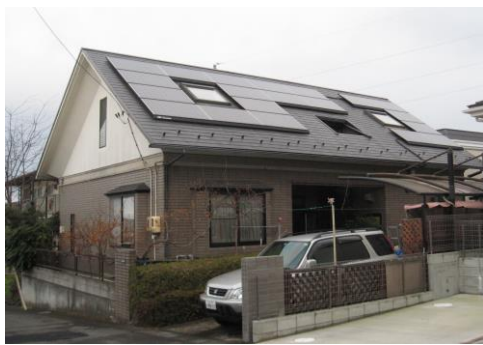
ソーラーパネルによる太陽光発電 クリーンエネルギー