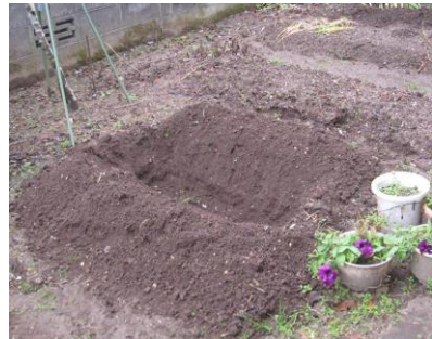
→ 冬季は土化が進まずコンポスト内 がいっぱいで庭に穴を掘って代用