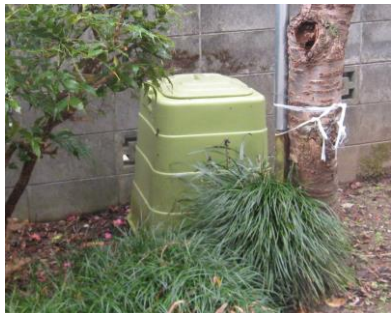
生ごみを堆肥にコンポスト 温室効果ガス削減