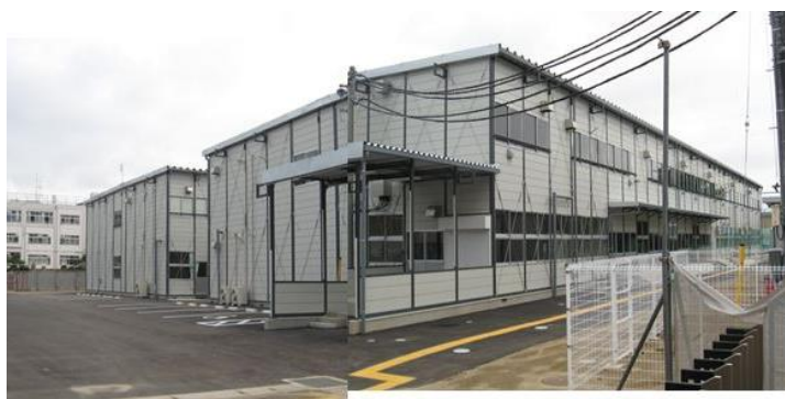
南門より（写真は合成）

現在、引っ越しの準備や仮設校舎で生活する上でのルールづくり等を行っています。9月からは現校舎側が工事現場となります。正門と北門が使えなくなり、遊具のエリアも制限されます。