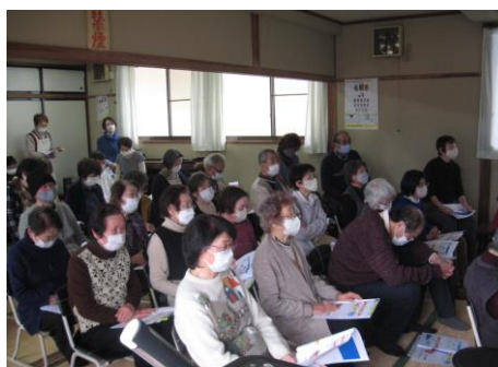
機器測定後にフレイル防止の講話