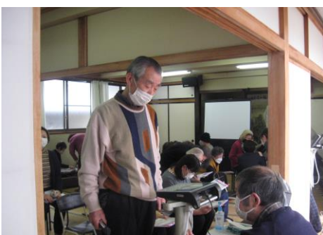
体組成測定：体重・体脂肪・筋肉量・骨量等が一度に測定 上写真が測定器