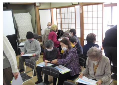
計測データを比べて話し合い